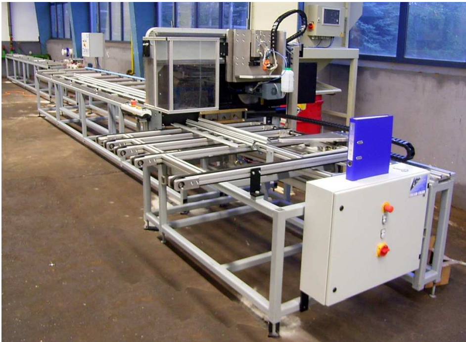
Foliermaschine für Aluminium Profile mit angeschlossener 3-Spur Säge